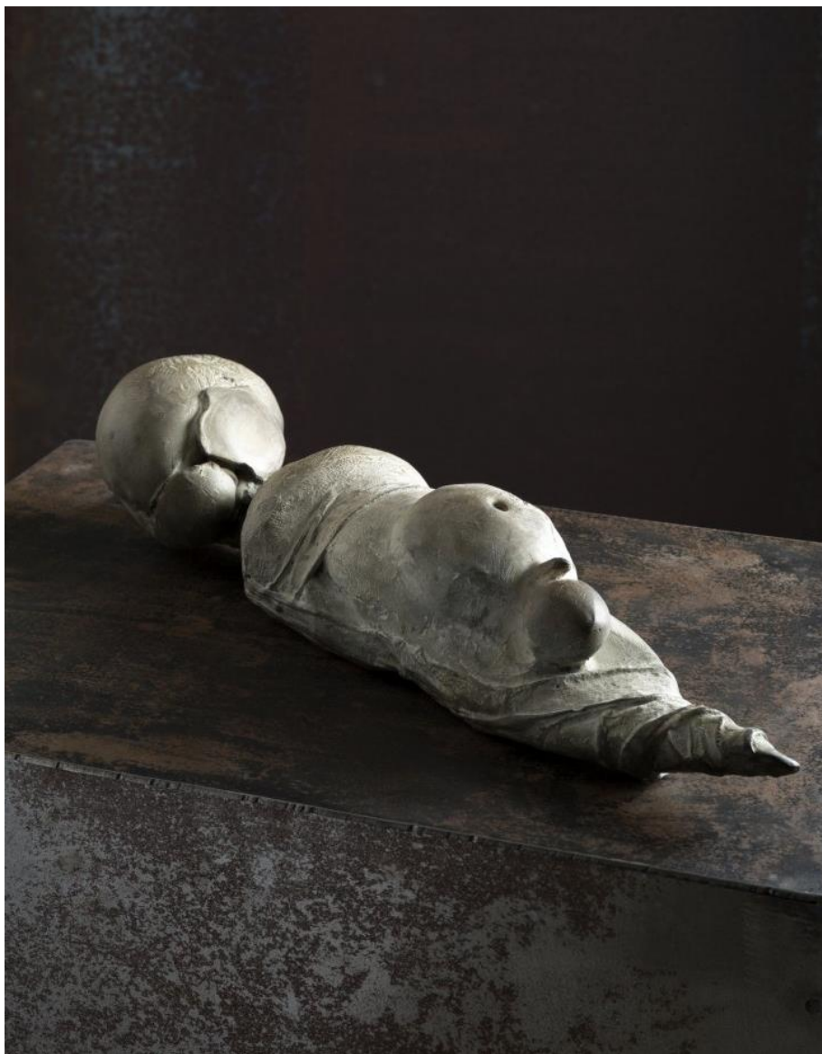
Infant I , 2011 Bronz, ijzer en zink 98 x 68 x 24 cm