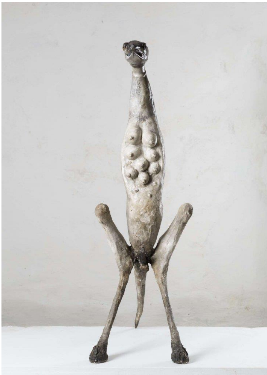
Archangel , 2015 Gypsum plaster en ijzer 113 x 37 x 82 cm