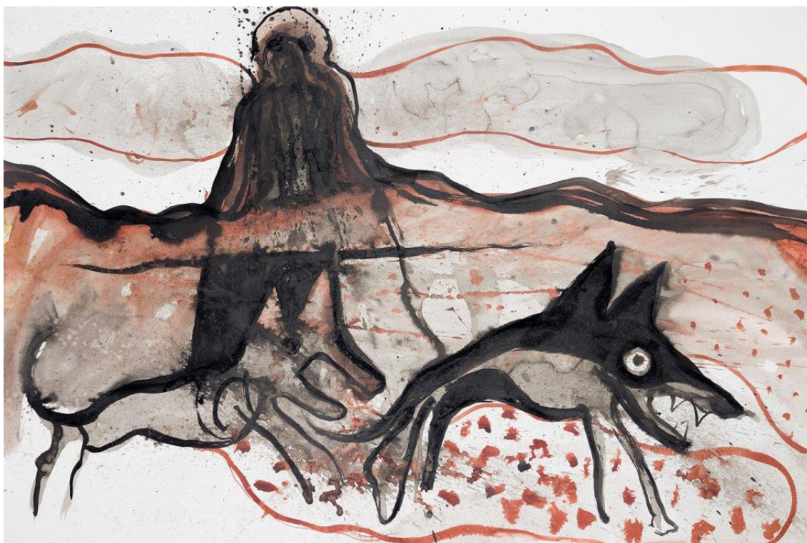
Lost 6 , 2015 Indische inkt en bister op papier 110 x 75 cm