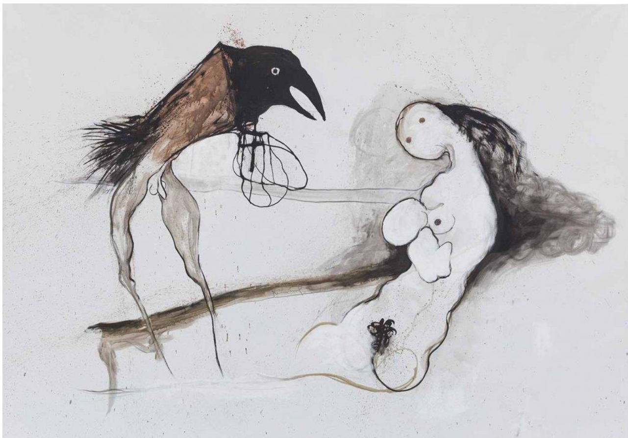
Mother & Child , 2017 Indische inkt en bister op doek 300 x 200 cm