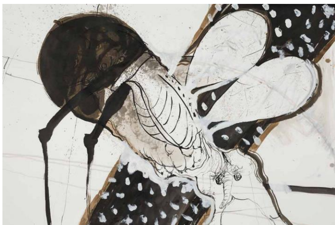
Archangel 3 , 2019 Indische inkt en bister op papier 75 x 110 cm