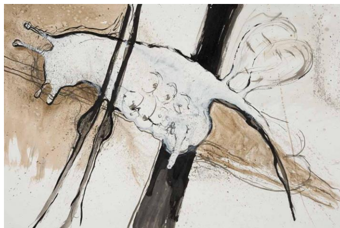
Archangel 4 , 2019 Indische inkt en bister op papier 75 x 110 cm