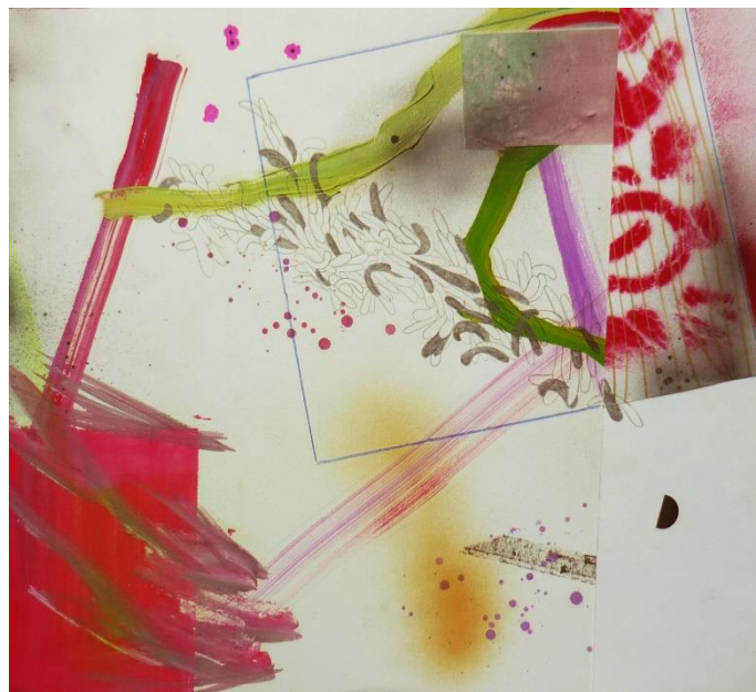
Charlotte Marchand, sans titre 34,5x31,2cm, peinture et collage sur papier