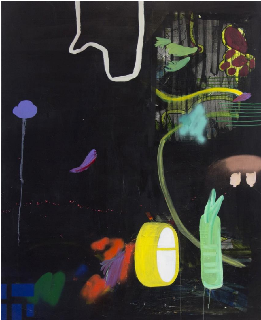
Charlotte Marchand, Danse 146x114cm, peinture sur toile