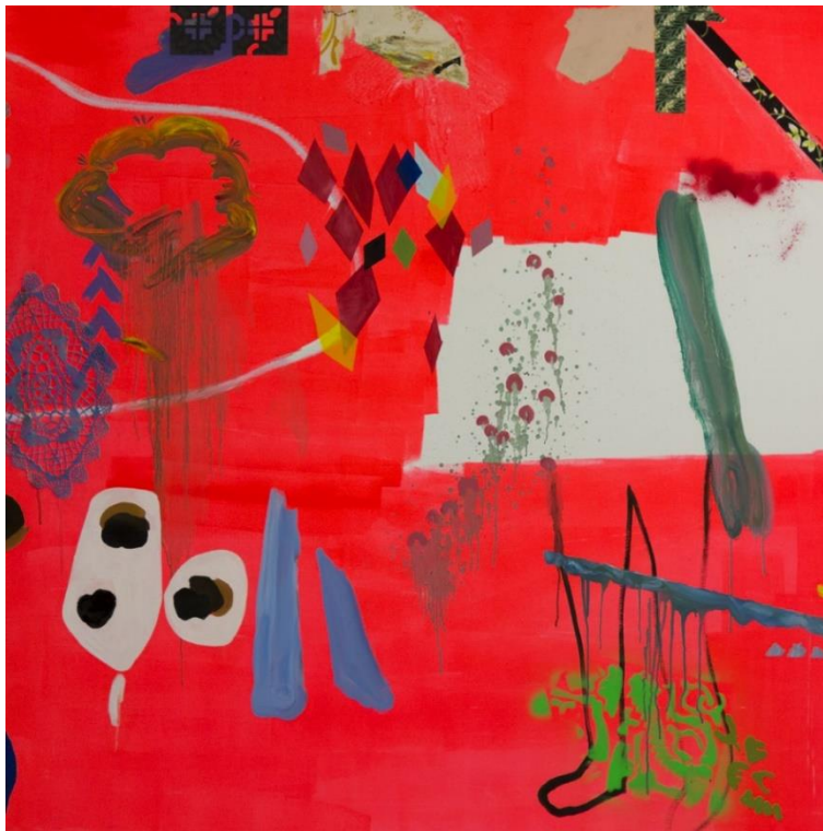
Charlotte Marchand, Hombre 150x150cm, peinture sur toile