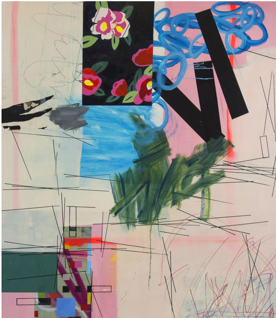
Charlotte Marchand, Japan 180x150cm, peinture sur toile